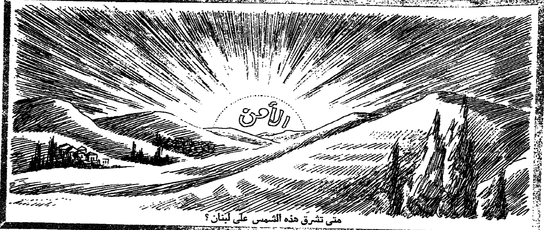
متى تشرق هذه الشمس على لبنان؟